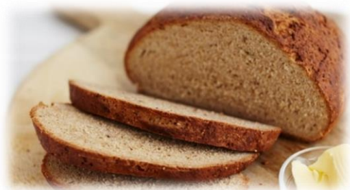
Pain à base de farine de blé et d'épeautre