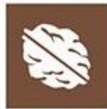
Fruits à coque