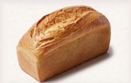
Pain froment avec levain de froment, beurre, céréales: 100% froment