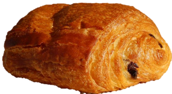
Pâte feuilletée au beurre, bâtons de chocolat