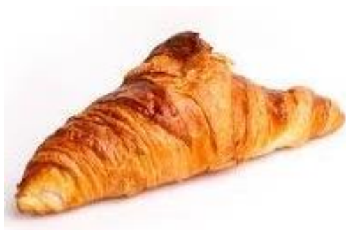
Pâte feuilletée au beurre