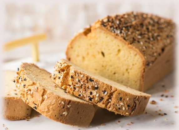
Pain multigrain avec froment, seigle, orge, graines de tournesol et graines de lin