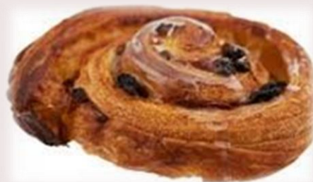
Pâte feuilletée au beurre, fourrage crème pâtissière, raisins secs