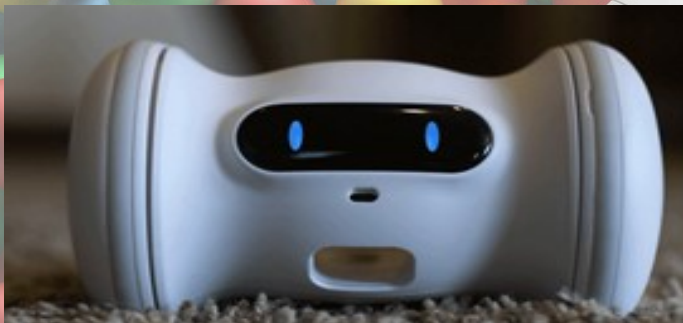
SMART ROBOT (Réf: FU_03)