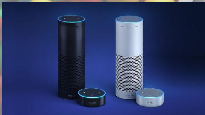
ALEXA BOX (Réf: FU_05)