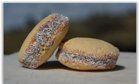
Alfajor de Maicena