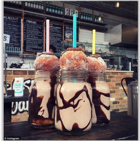
Milkshake « Berliner »