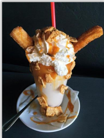
Milkshake « Churro »