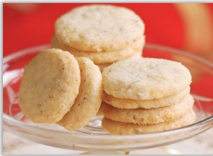
Portatif Chip Cookie