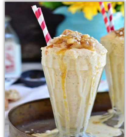
Milkshake « Apple Pie »