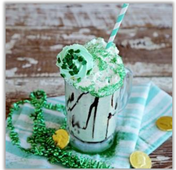
Milkshake « Chocolate mint »