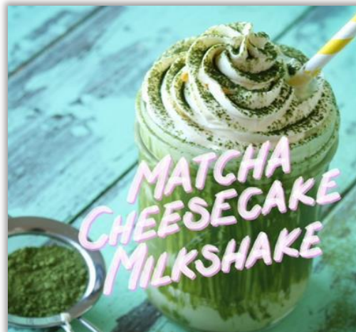
Milkshake « Matcha Cheesecake »