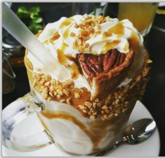
Milkshake « Pastel De Nata »