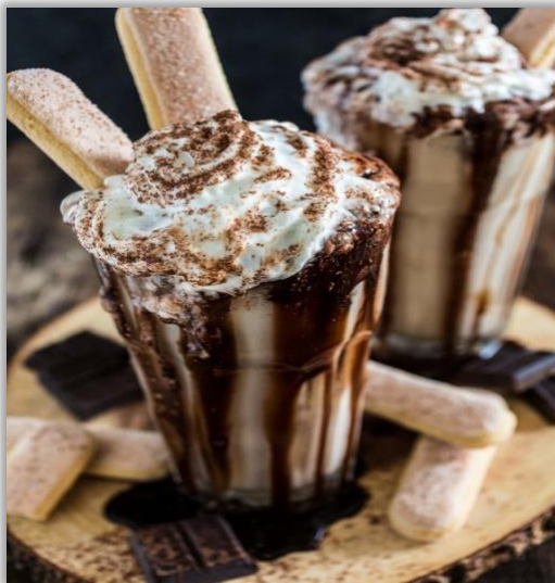
Milkshake « Tiramisu »