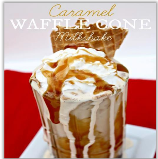
Milkshake « Waffle »