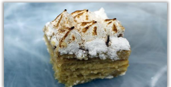
Bien Me Sabe