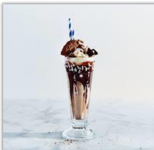
Milkshake « Gingerbread Rosella »