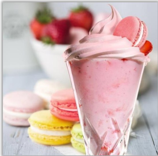
Milkshake « Macarons »