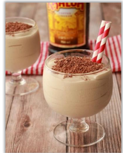
Milkshake « Dom Pedro »