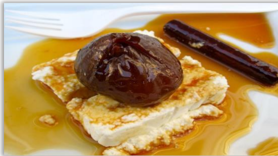
Diocèses De Berevas