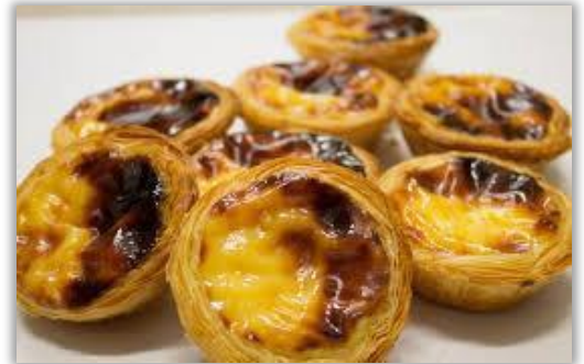
Pastel de Natas