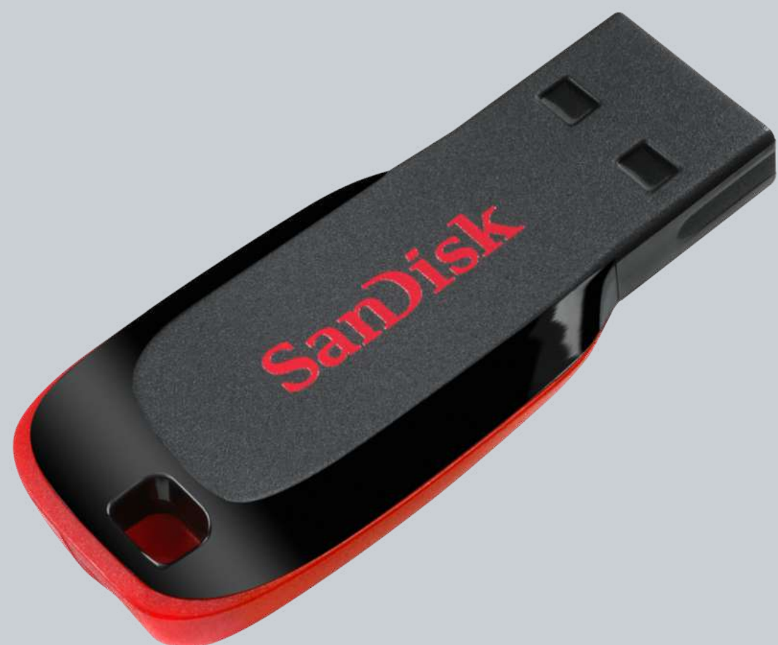
CLÉ USB SANDISK CRUZER BLADE - 128 GB €22,99 Réf.: CLE001