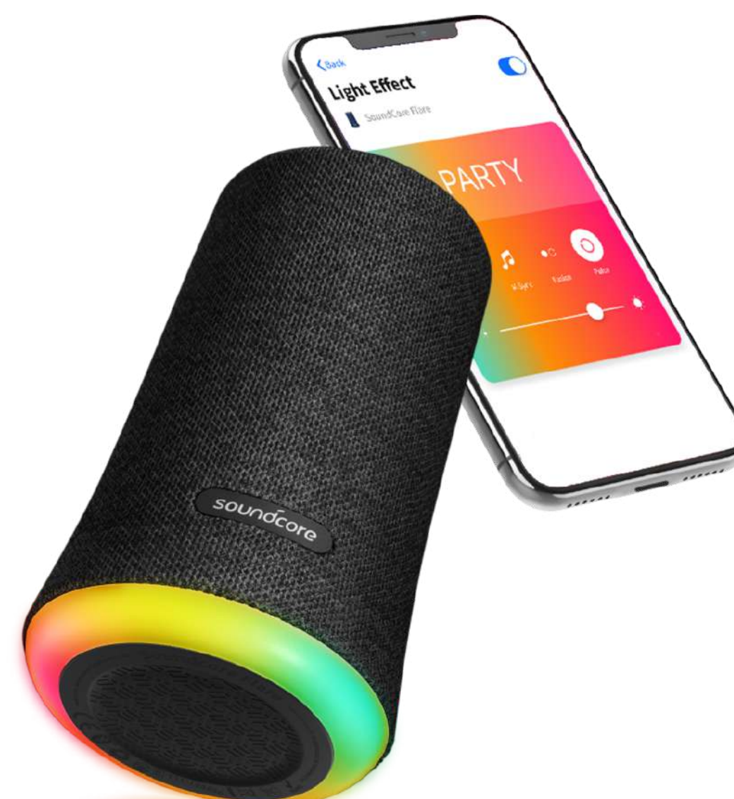
ENCEINTE BLUETOOTH ANKER SOUNDCORE FLARE €120,99 Réf.: SAMTV001