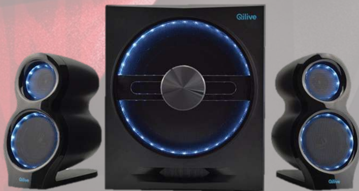
ENCEINTES GAMING QILIVE 2.1 Q.8556 €89,98 Réf.: EN004