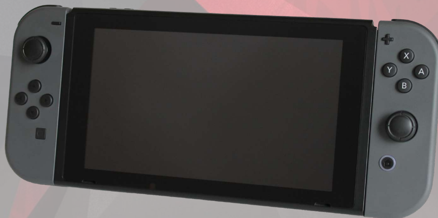
CONSOLE NINTENDO SWITCH €299,99 Réf.: NIN001