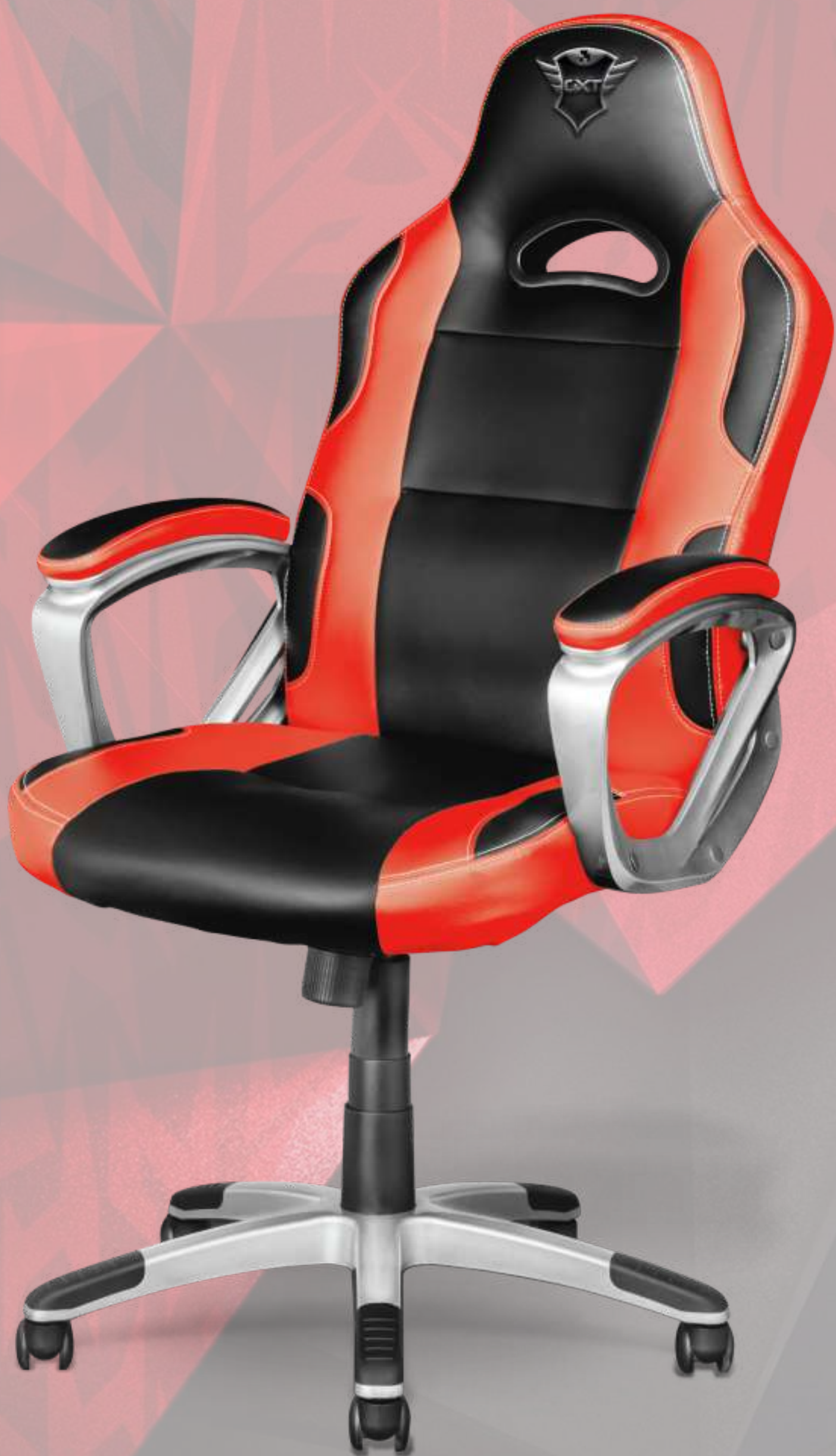
CHAISE GAMING TRUST RYON CADTRU