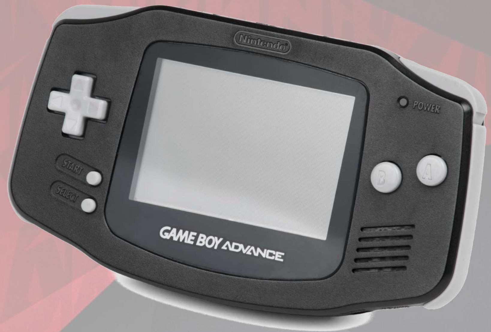
CONSOLE GAMEBOY ADVANCE €40,60 Réf.: GA001