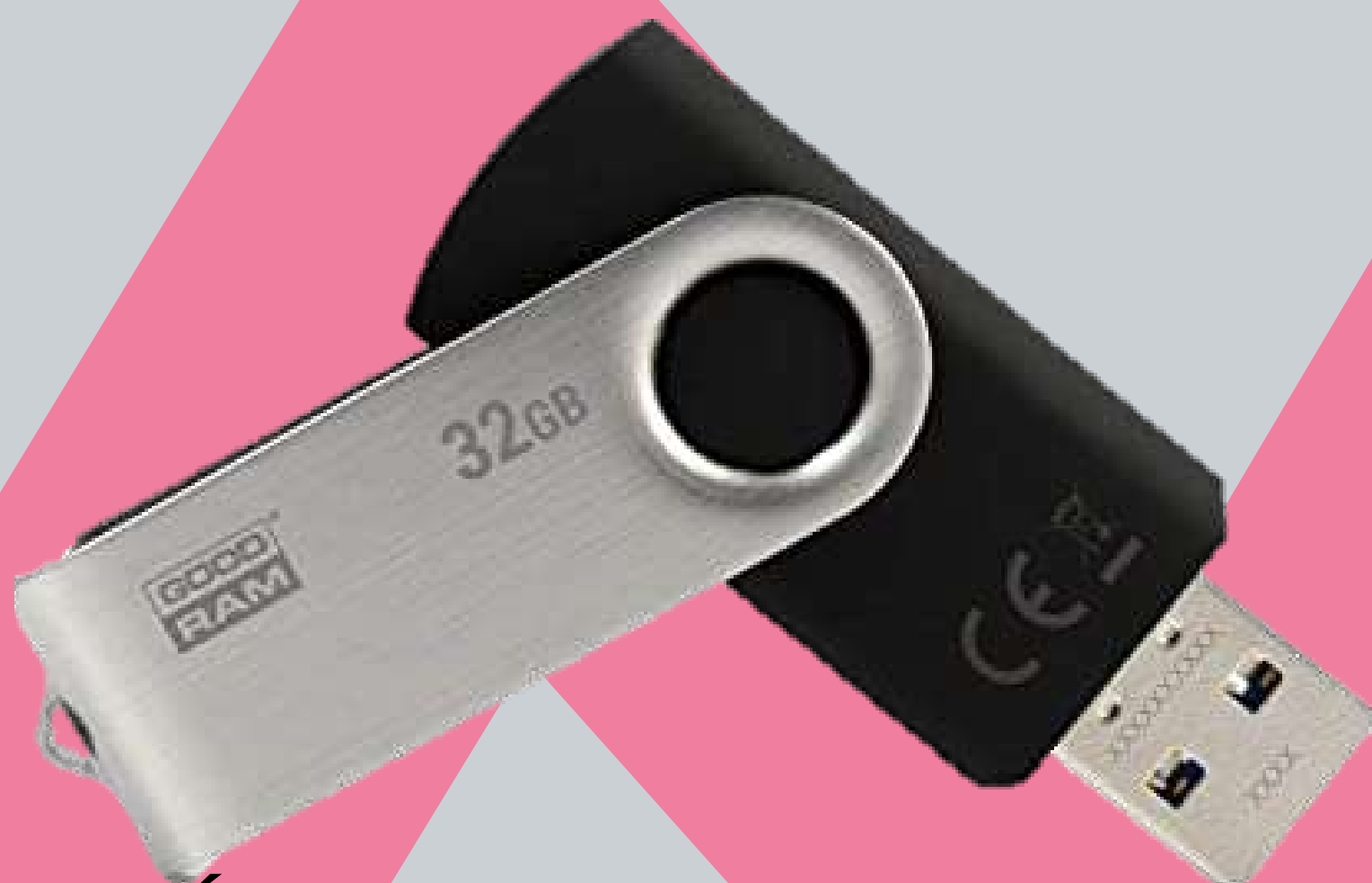
CLÉ USB GOODRAM 32 GB TWISTER BLACK €12,99 Réf.: CLE003