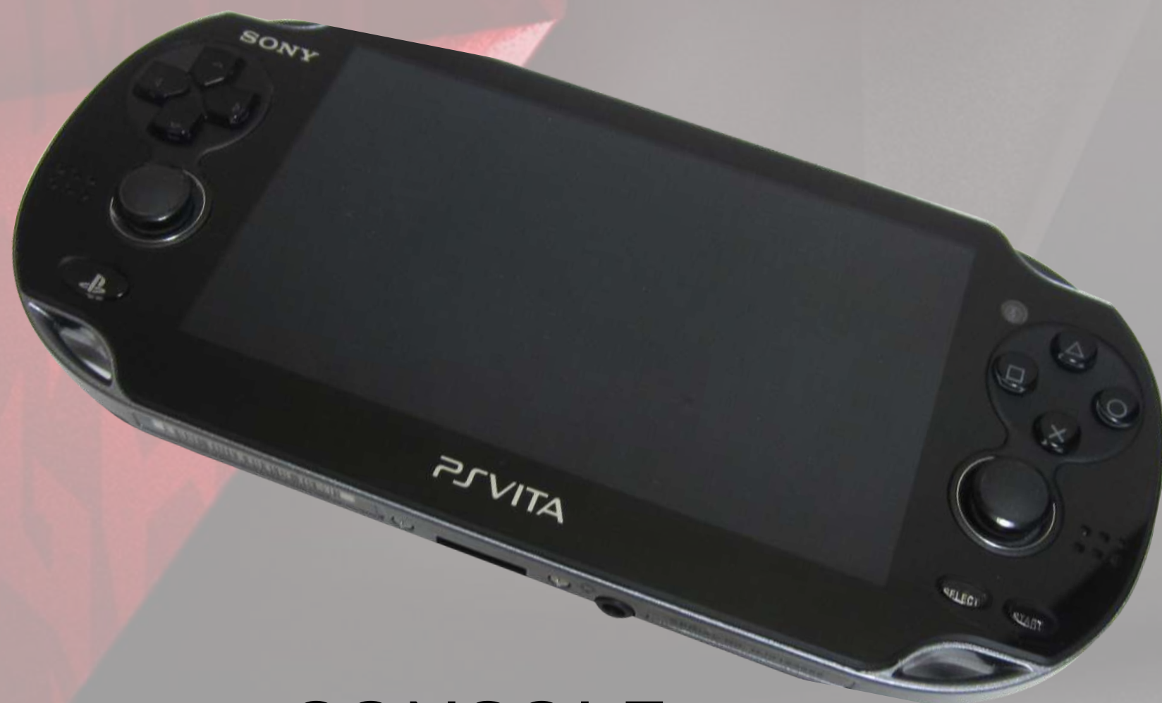
CONSOLE PS VITA €119,93 Réf.: PSV001