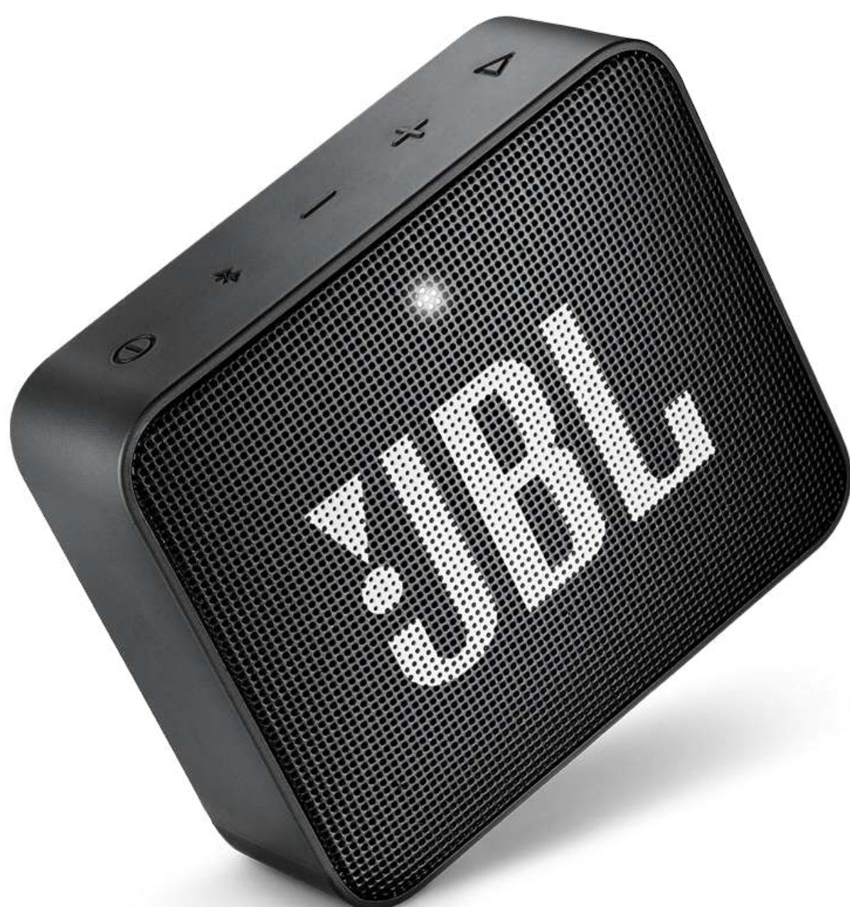
BT MINI ENCEINTE JBL GO 2 NOIR €29,99 Réf.: SAMTV001