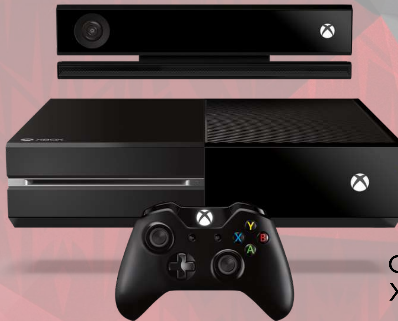
CONSOLE XBOX ONE €399,99 Réf.: XBOX001