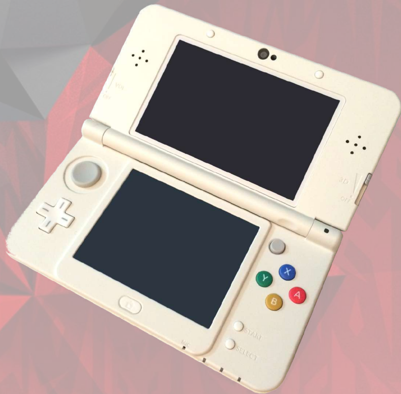
CONSOLE NINTENDO 3DS €112,95 Réf.: EN001