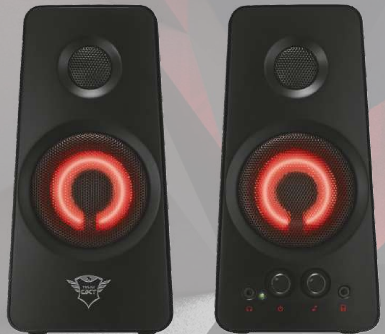
ENCEINTES 2.0 TRUST GTX €59,99 Réf.: EN004