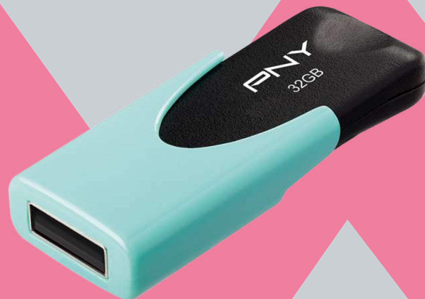
CLÉ USB PNY 32GB BLUE €12,99 Réf.: CLE004