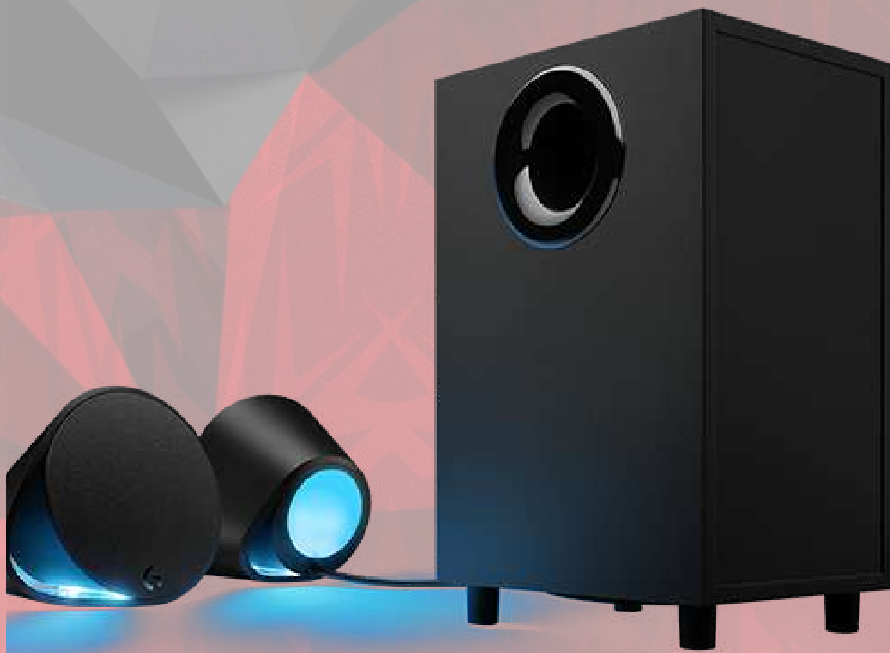
ENCEINTES 2.1 HP GAMING X1000 €120,00 Réf.: EN001