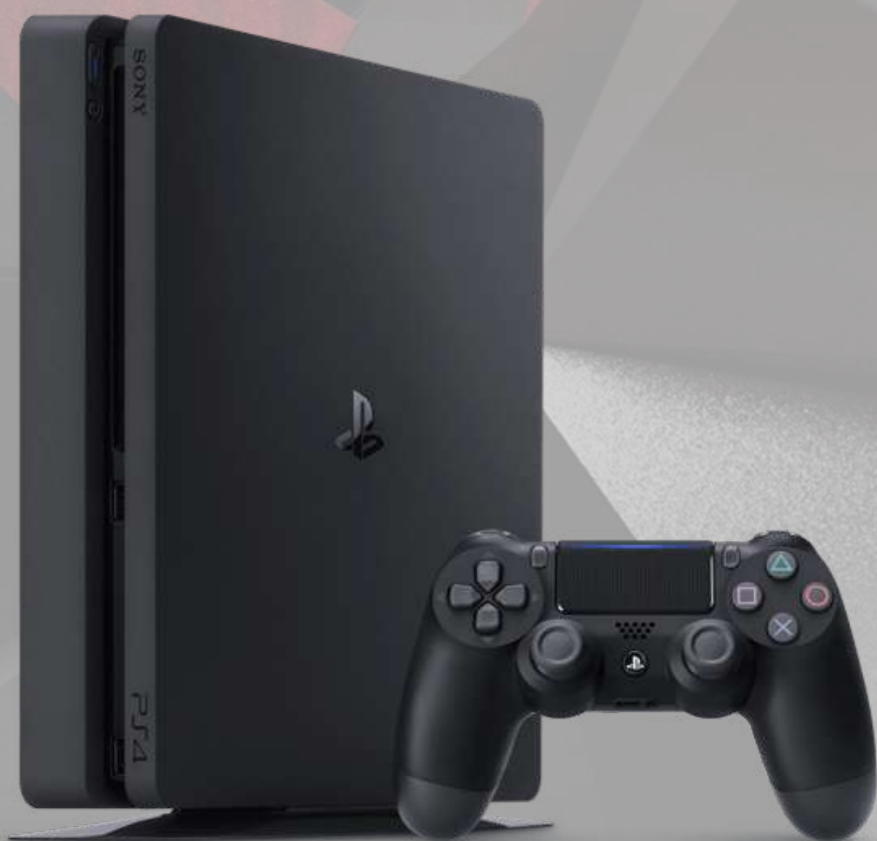
CONSOLE PLAYSTATION 4 €299,99 Réf.: PLAY4001