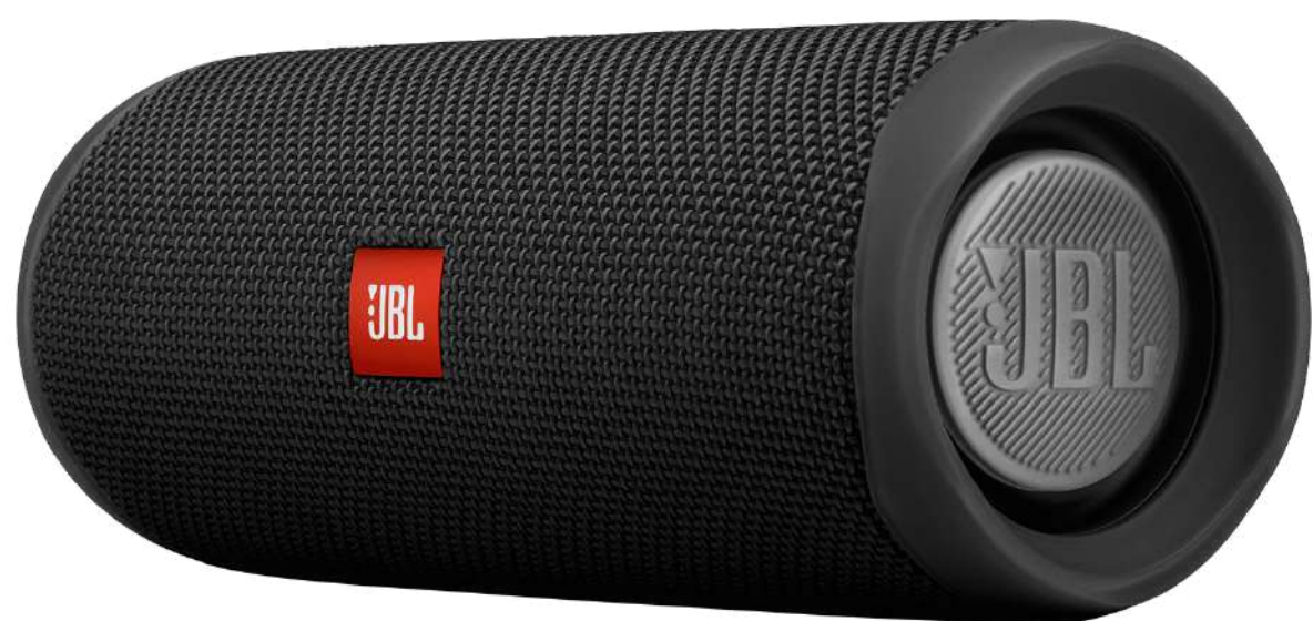
ENCEINTE BLUETOOTH JBL CHARGE 4 €179,99 Réf.: JBL001