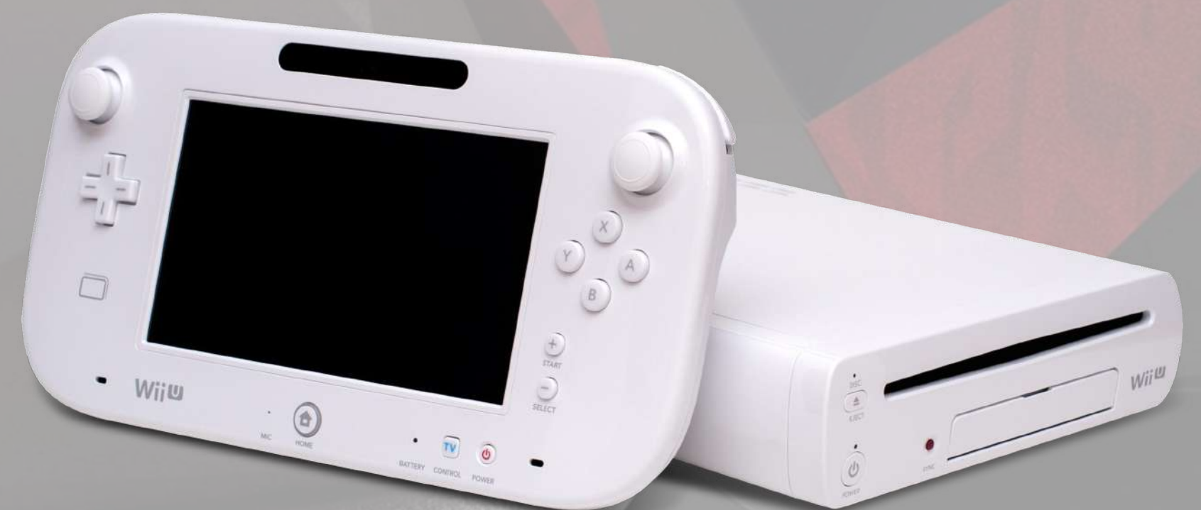
CONSOLE WII U €124,00 Réf.: WII001