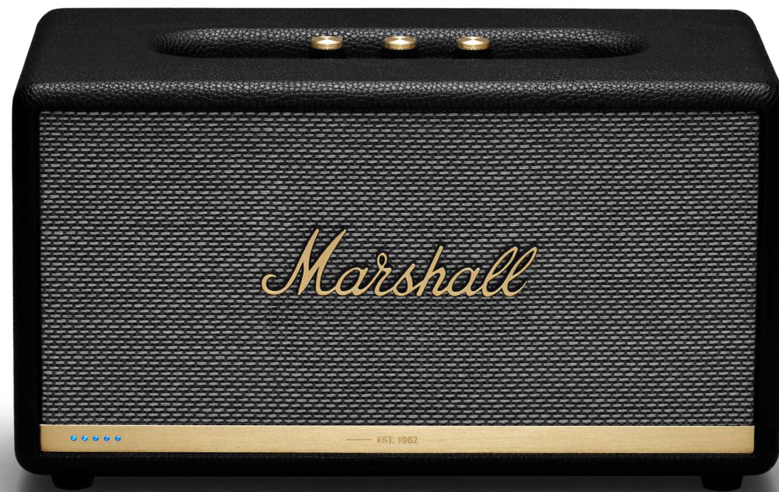
ENCEINTE BLUETOOTH MARSHALL ACTON II €212,99 Réf.: SAMTV001