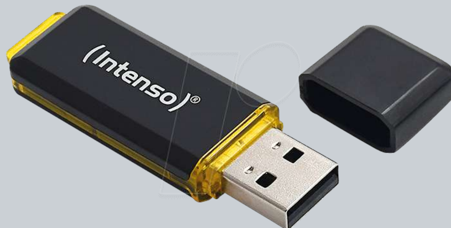
CLÉ USB INTENSO 256GB SPEED LINE €30,99 Réf.: CLE002