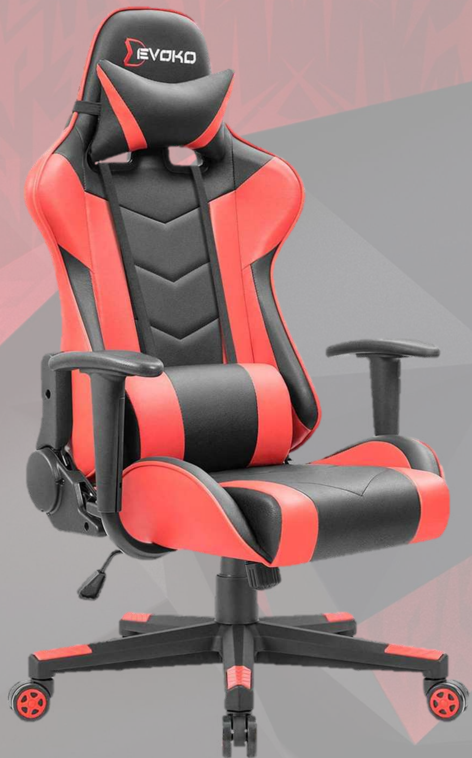
DEVOKO CHAISE ERGONOMIQUE GAMING RACIN