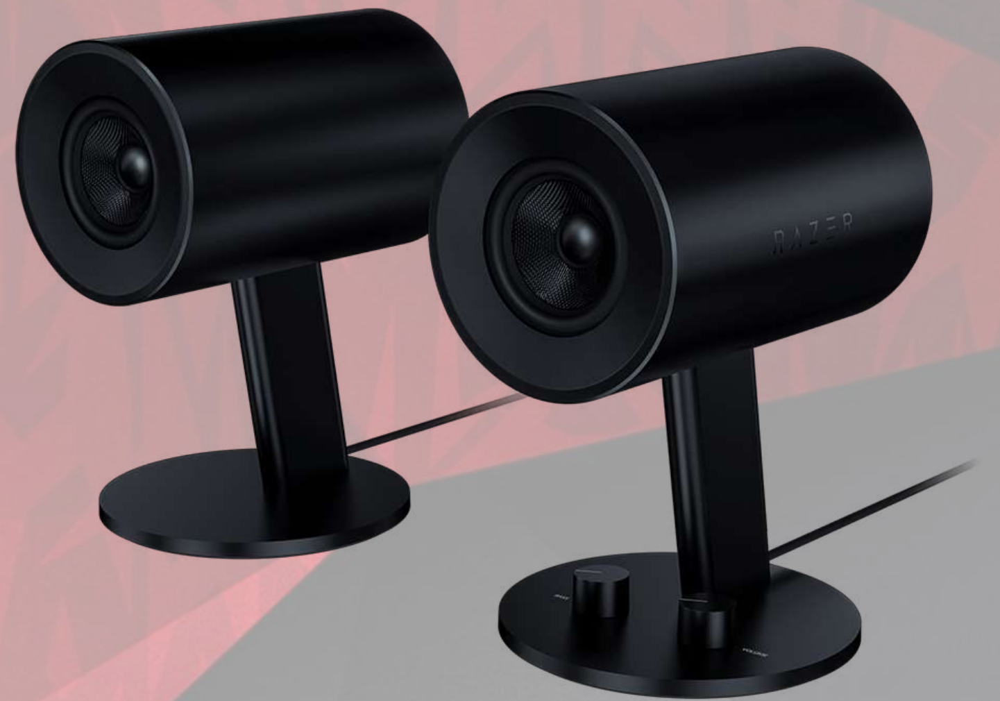
ENCEINTES 2.0 RAZER NOMMO CHROMA €169,99 Réf.: EN002