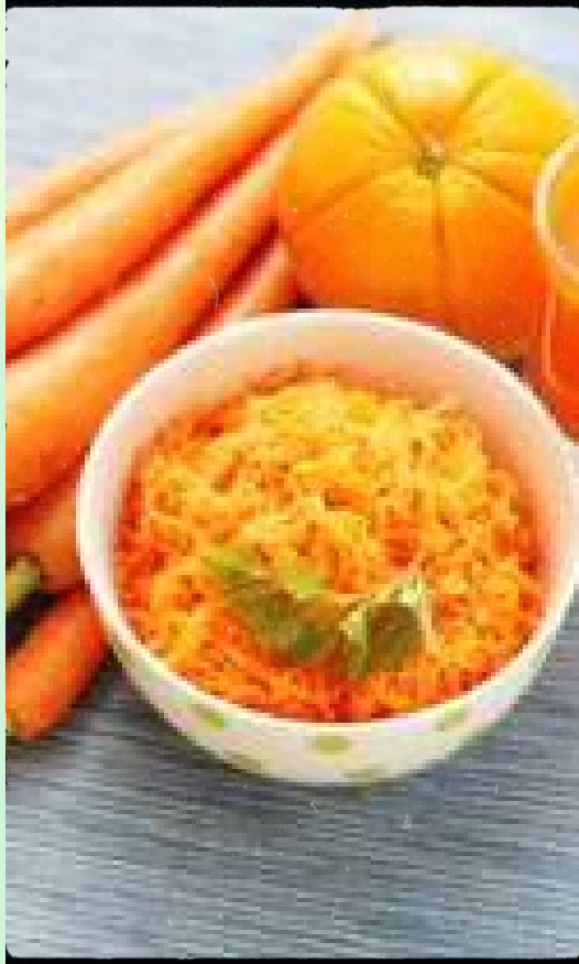
2x Salade de carottes Réf: SA-01