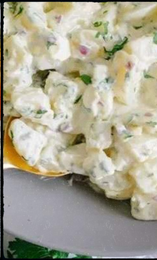
2x Salade de pommes de terre Réf: SA-03