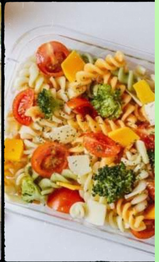
2x Salade de pâtes Réf: SA-02