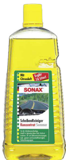
SONAX Lave glace concentré Citron (500 ml)