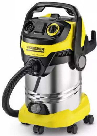
KÄRCHER Aspirateur multifonction WD6P