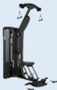
Dual station - Poitrine et Épaule 3.500,00 € Réf : MA-006