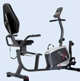
Vélo assis 650,00 € Réf. : MA-004