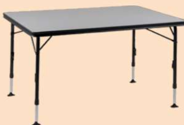
TABLE DE CAMPING