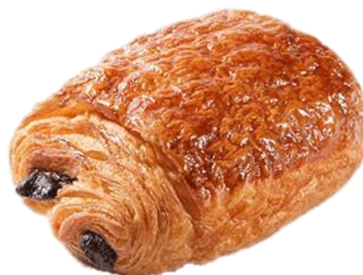
Pain au chocolat 1.70 € Réf. V2