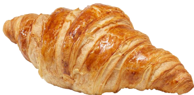
Croissant au beurre 1.50 € Réf. V1