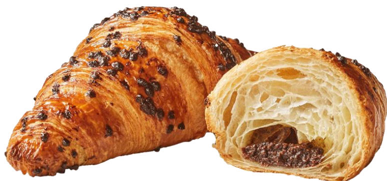
Croissant au chocolat 1.80 € Réf. V3