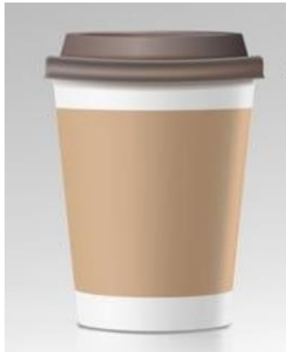
Café Latte Macchiato 20cl 3.35 € Référence C2