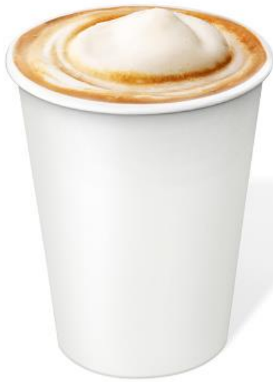
Capucino Italien 20cl 3.10 € Référence C2