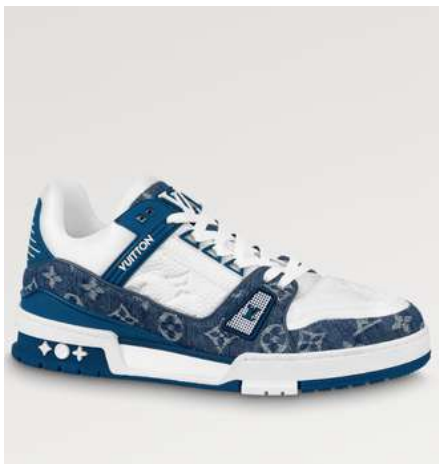
LV TRAINERS MLV007