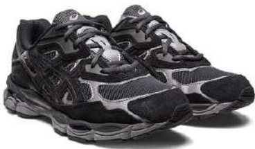
ASICS GEL-NYC MAGN011