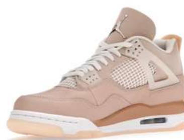
JORDAN 4 SHIMMER FJS004