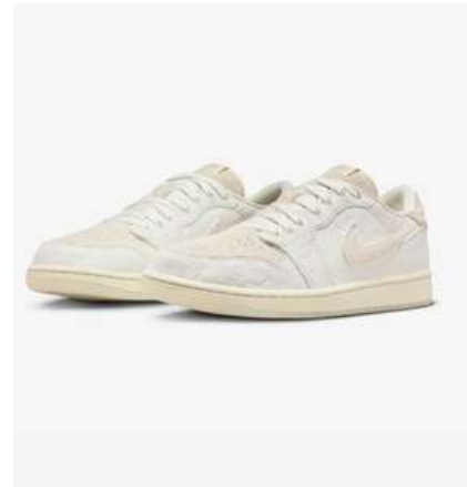
JORDAN 1 LOW X CHRIS PAUL FJC006