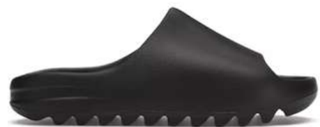
ADIDAS YEEZY SLIDE MAZ006