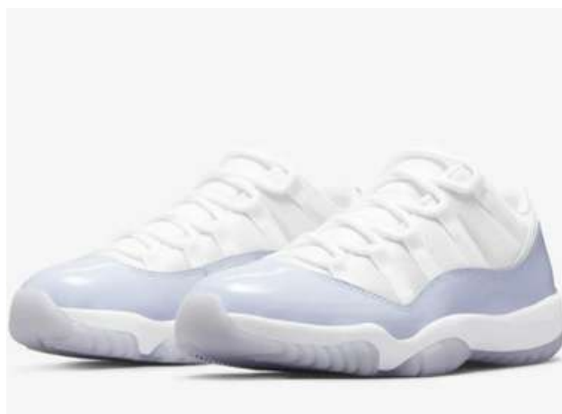
JORDAN 11 LOW P.VIOLET