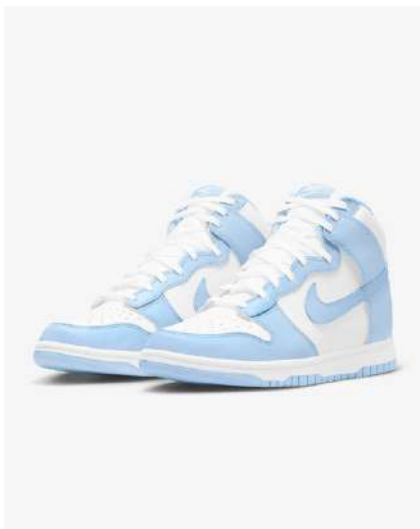
NIKE DUNK HIGH FNH007