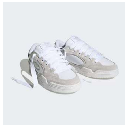
CHAUSSURE ADI2000 X