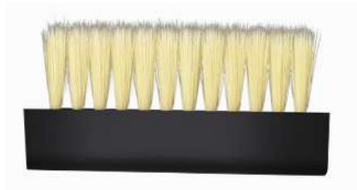
BROSSE À CHAUSSURE