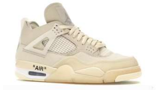
JORDAN 4 RETRO OFF-WHITE MJR010