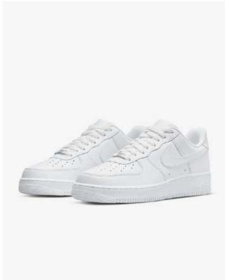
AIR FORCE 1 MA001