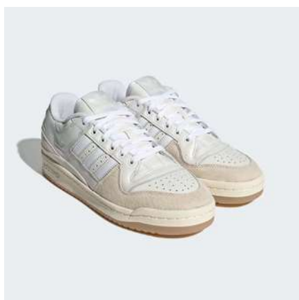
ADIDAS FORUM 84 LOW