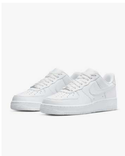
AIR FORCE 1 FA001