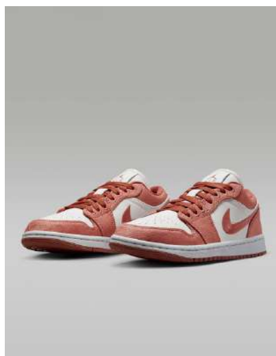
NIKE DUNK FD002