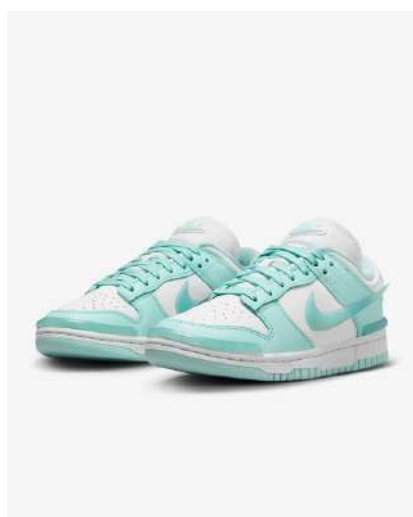
DUNK LOW TWIST FDT003