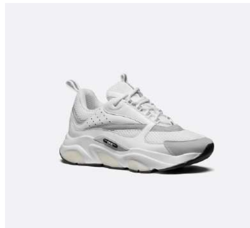
DIOR B22 MD012