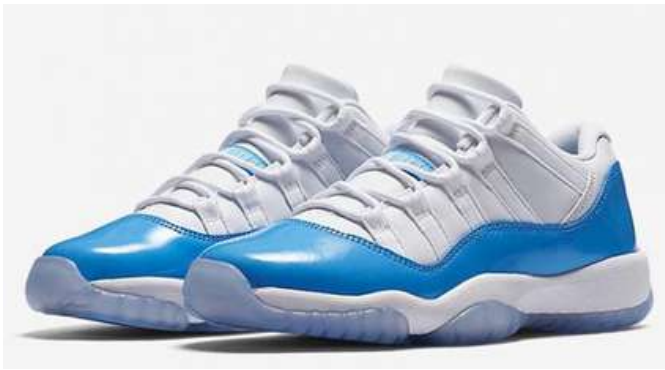
JORDAN 11 LOW CAMPUS FJC005