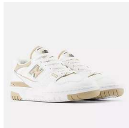
NEW BALANCE 550 FNB008