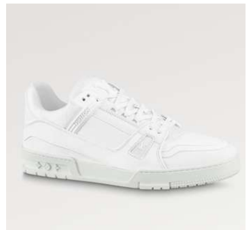
LV TRAINERS MLV008