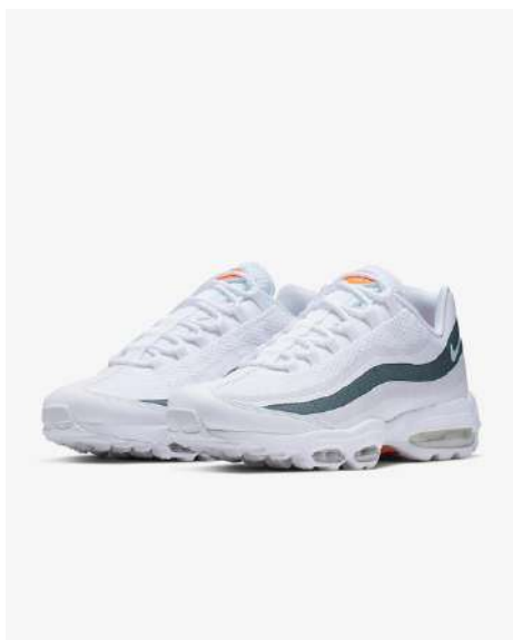
AIR MAX 95 ULTRA M95A003