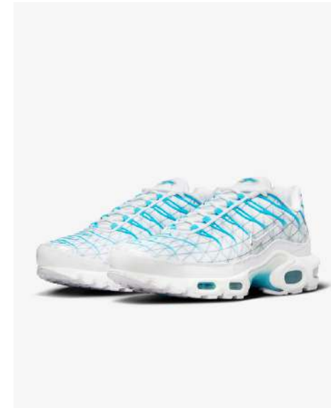
TN (MARSEILLE) MT004