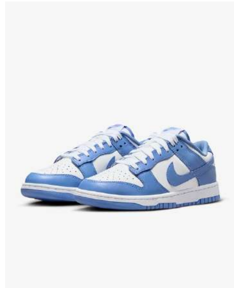
NIKE DUNK MD002