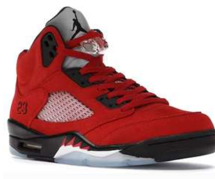
JORDAN 5 BULLS