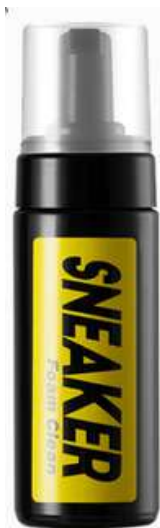
SPRAY DE PROTECTION