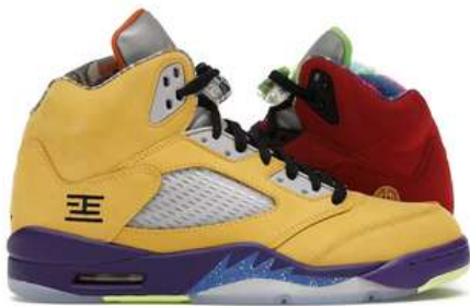
JORDAN 5 RETRO MJ005