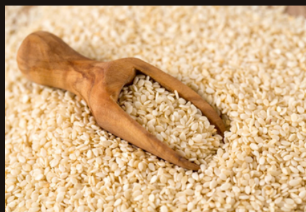
Sesame Seeds (5)