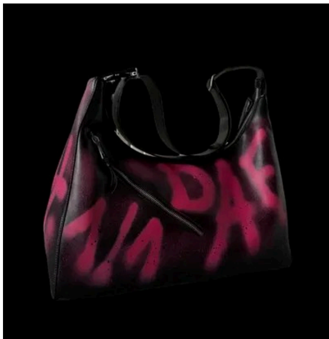
Pink "NOT 4 SALE" graffiti leather bag Réf.PB22