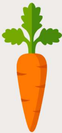
Tableau de Référence